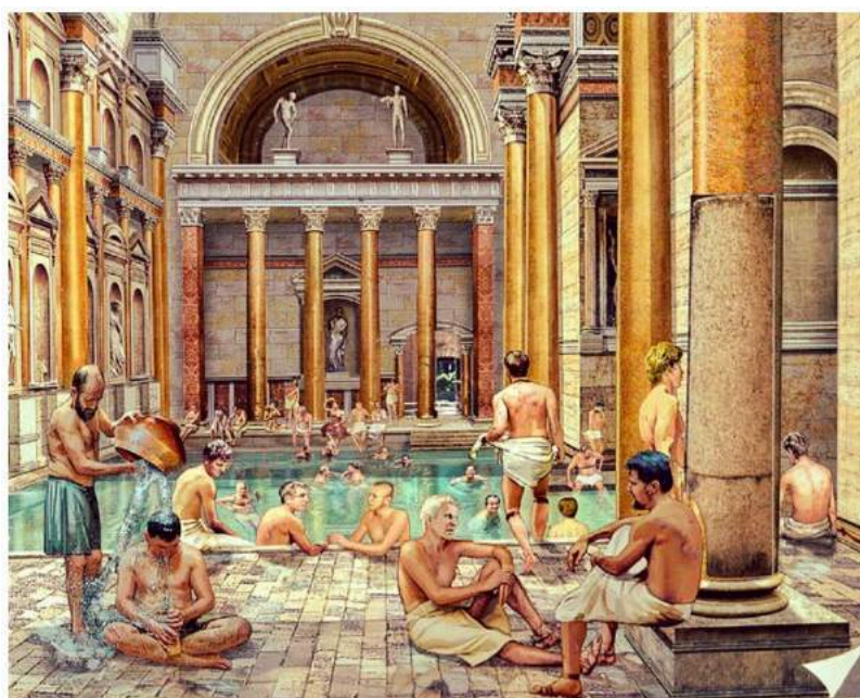
Reconstitution des thermes de Caracalla, à Rome

Plus d'informations : voir le programme détaillé p42 sur le www.festival-arelate.com